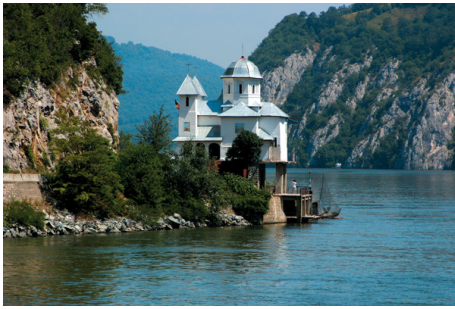
... auf der Donau bis zum Delta

Es gibt wohl keine bequemere Möglichkeit, in nur zwei Wochen acht Länder zu bereisen. Dabei gilt: Die Mischung macht's! Besichtigungen der Metropolen Wien, Budapest und Belgrad wechseln sich ab mit entspannten Flusstagen und erholsamen Stunden auf dem Sonnendeck. Dort, wo die Donau die Katarakte durchbricht, zieht eine majestätisch schöne Landschaft gemächlich vorbei. Natürliche Harmonie empfängt Reisende schließlich dort, wo sich die Natur noch im Gleichgewicht befindet: Das Donaudelta ist Heimat von Pelikanen, Silberreiher, Ottern und zahlreichen Fischarten.