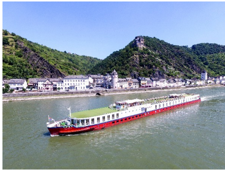
Unterwegs auf Rhein, Mosel und Saar

Zwischen der Domstadt Köln, dem Großherzogtum Luxemburg und dem gemütlichen Saarland erwartet Sie eine Kreuzfahrt durch sagenumwobene Landschaften. Zahllose Vulkane und deren Vermächtnisse entdecken Sie in der Eifel zwischen Rhein und Mosel. In Trier wandeln Sie auf den Spuren der Römer in Deutschlands ältester Stadt. Herrliche Ausblicke auf Vater Rhein genießen Sie bei einer Fahrt mit der Drachenfelsbahn. Entlang der leiblichen Mosel erwartet Sie Deutschlands beliebtestes Weinbaugebiet. Kommen Sie an Bord!